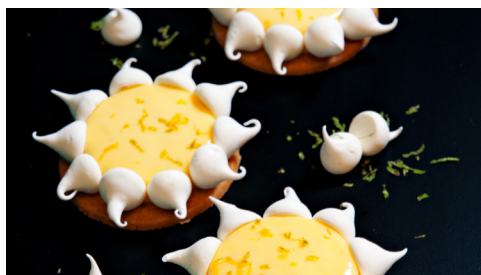
La Maison Old Course #02